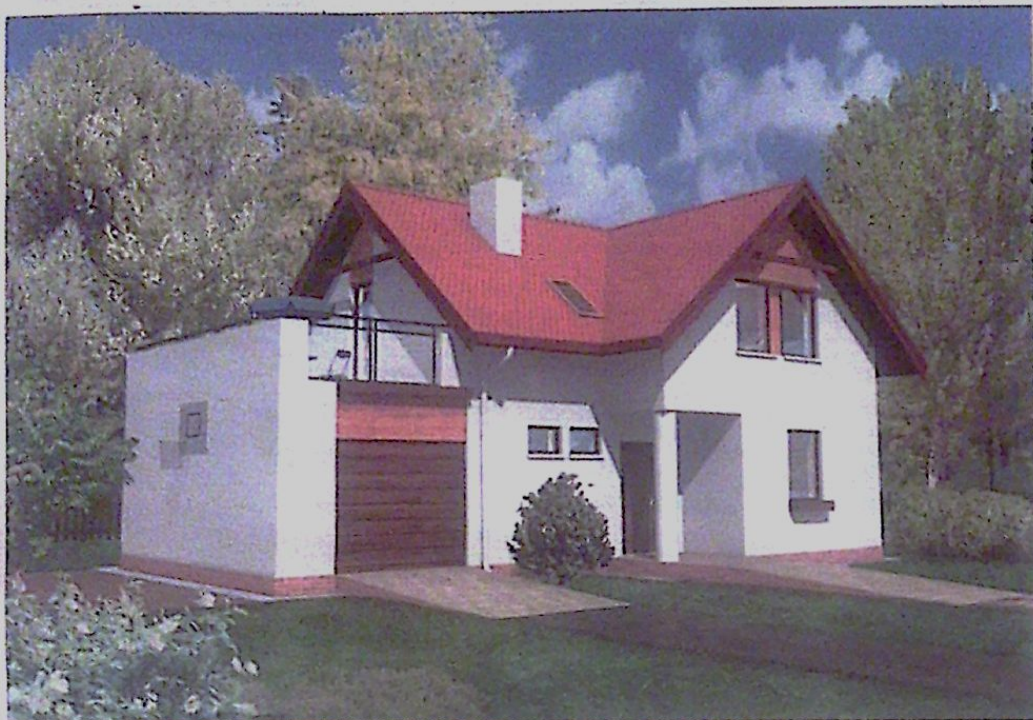
Widok od frontu.