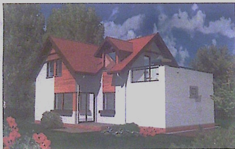
Widok od strony ogrodu.